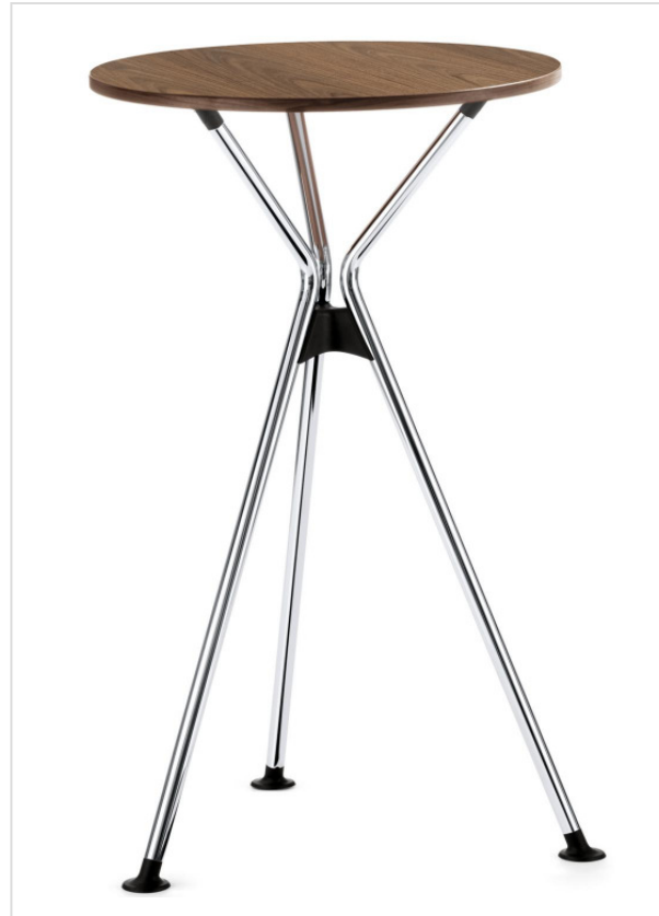
Design: Modus Product Design / speziell®