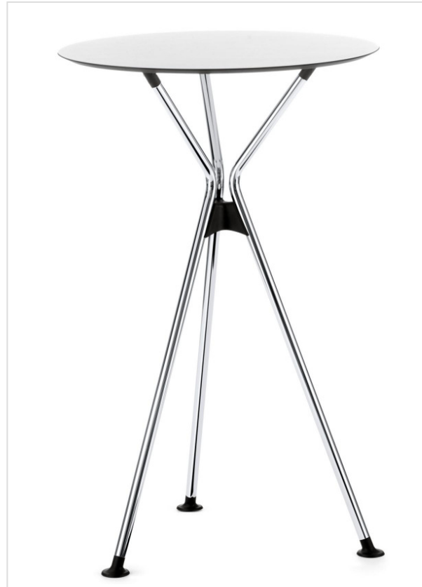
Design: Modus Product Design / speziell®